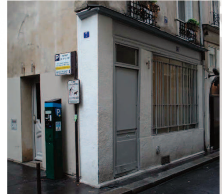
L'agence de la rue du Pélican à Paris

De 1954 à 1957, dans un modeste local, a démarré l'étude, l'invention et le montage d'opérations :